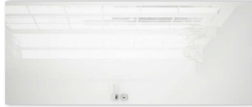
SILIA 10 bianco