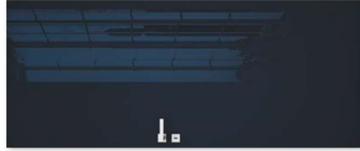
SILIA 10 notte