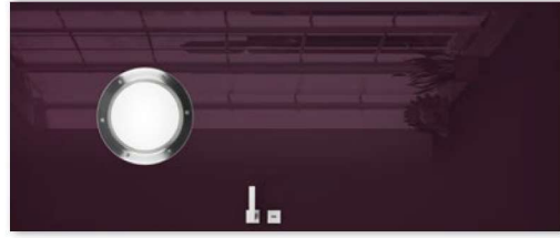
BULAJ STALOWY vino

Uwaga: możliwość wyboru obrzeża z wzorem dotyczący wyłącznie drzwi w dekorze białono.