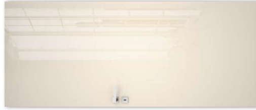
SILIA 10 magnolia