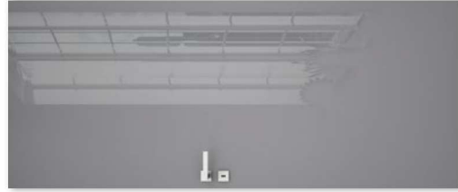
SILIA 10 gabbiano